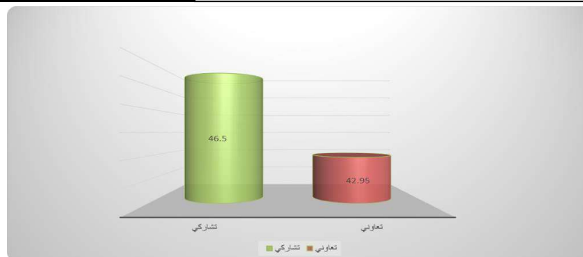
شكل (٣) متوسطات درجات طلاب المرحلة الثانوية في التطبيق البعدي لاختبار الجانب المعرفي لمهارات تصميم قواعد البيانات ترجع الى الأثر الاساسى لاختلاف نمطي التعلم (التشاركي-التعاوني)